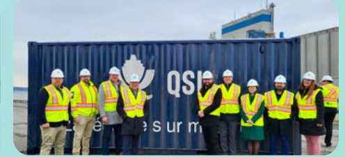
Saint-Joseph-de-Sorel - Terminal portuaire de QSL