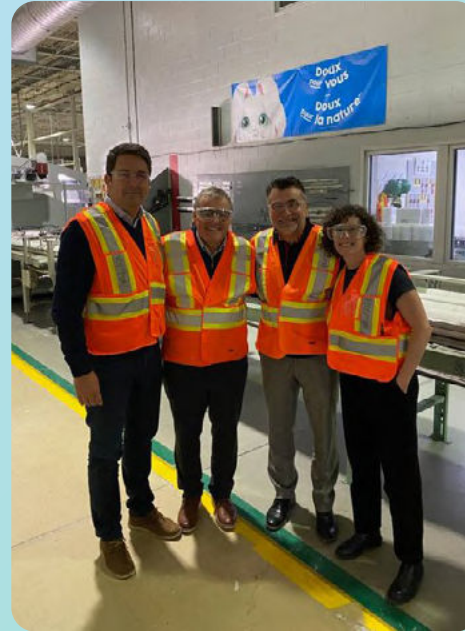
Kingsey Falls - Cascades