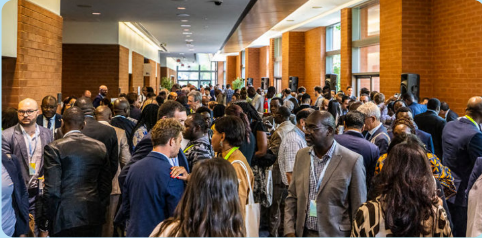
Arrivée des participantes et participants au Centre des congrès de Québec REF 23