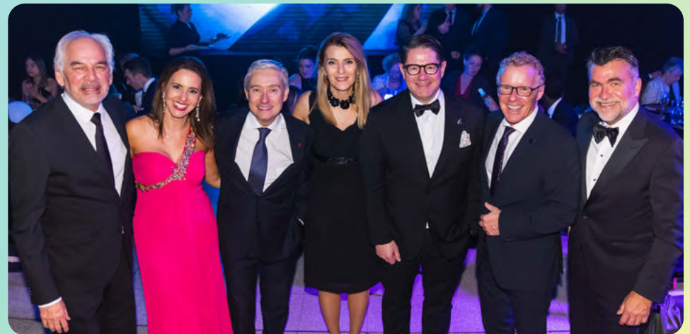
Invités spéciaux à la deuxième édition