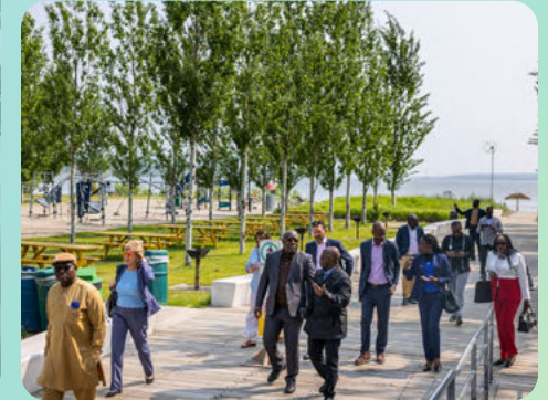
Port de Québec