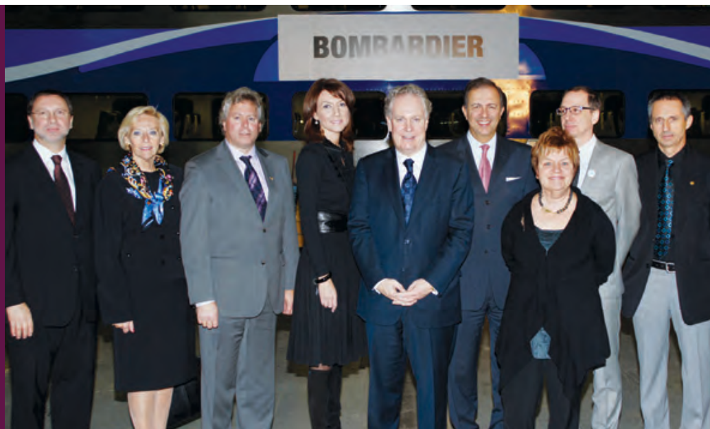
Le président du Conseil du patronat du Québec lors de la conférence de presse annonçant le renouvellement des voitures du métro de Montréal, en présence notamment du premier ministre du Québec, M. Jean Charest.