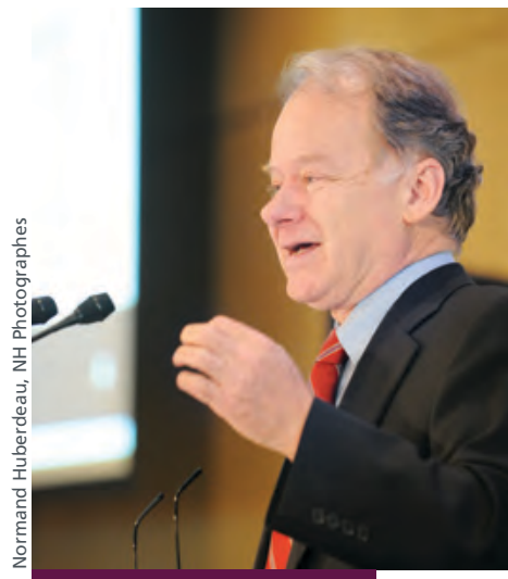
M. Raymond Bachand, ministre des Finances du Québec