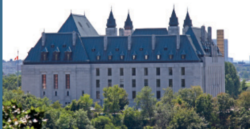
Cour suprême du Canada