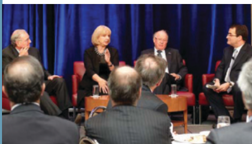
Le prestigieux panel composé de Paul Martin, Monique Jérôme-Forget et Bernard Landry était animé par Jean Lapierre.

En décembre, plus de 200 dirigeants d'entreprises et d'associations sectorielles, décideurs politiques et représentants des médias ont assisté au déjeuner-causerie organisé par le CPQ pour célébrer son 40 e anniversaire de fondation. Trois anciens ministres des Finances, dont deux ont aussi occupé les fonctions de premier ministre (Paul Martin, Bernard Landry et Monique Jérôme-Forget), ont témoigné de la contribution importante du CPQ au cours de son histoire et du rôle qu'il est appelé à jouer dans le contexte économique actuel.