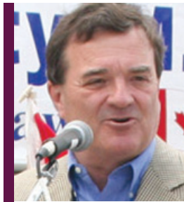
L'Honorable Jim Flaherty, ministre des Finances du Canada.

■ À Québec – Le budget 2009-2010 (déposé en mars 2009) et le budget 2010-2011 (déposé en mars 2010) répondaient tous deux à des propositions faites par le CPQ lors des consultations prébudgétaires menées en février et en décembre 2009, et notamment la volonté du gouvernement de revenir rapidement à l'équilibre budgétaire en comprimant la croissance de ses dépenses.